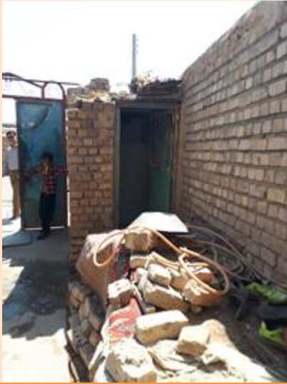
توالیت واقع در حیاط