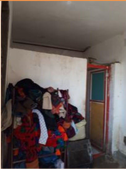
درب ورود حمام در کنار اتاق شماره ۲