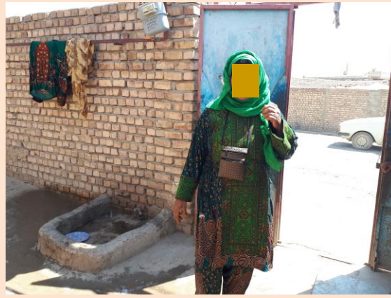
نمای درب حیاطو پاشور