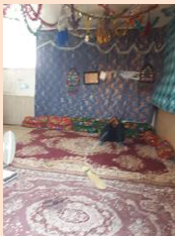
نمای اتاق ۲ ( پسر تازه ازدواج کرده خانواده و عروس)