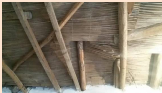
نمای اتاق ۲