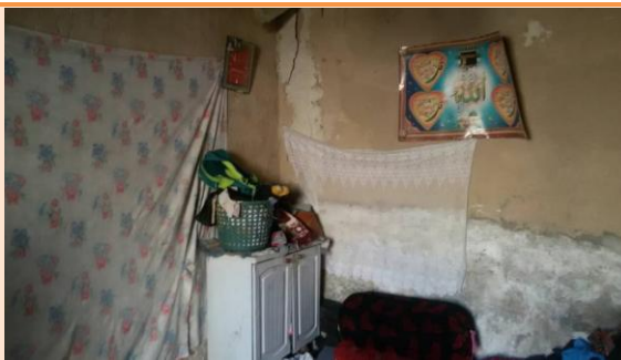
نمای اتاق ۲