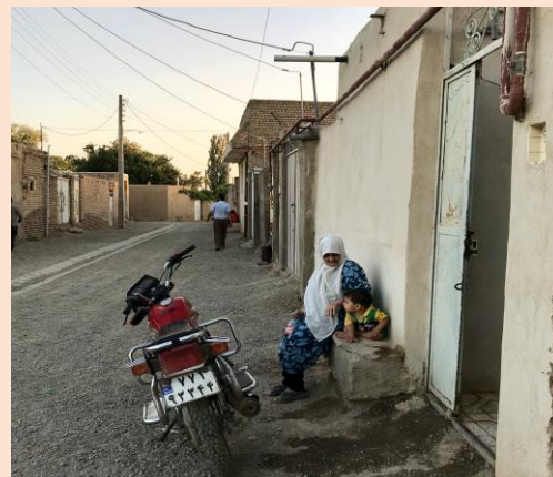
نمای سردر از معبر اصلی (ورود از شرق)