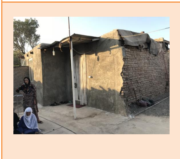
نمای شمال و غرب حیاط

توضیحات عکس: محله رحیم آباد (روستای سابق رحیم آباد) در حوزه جنوبی شهر نیشابور قرار دارد. در کنار زمین های کشاورزی و باغ های قدیمی شاهد سکونت مهاجران از مناطق مختلف کشور در طول پنج دهه گذشته هستیم.